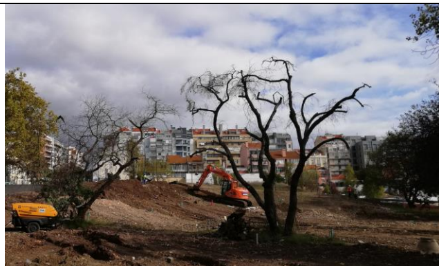
Exemplares 100673693076 e 100673693097.