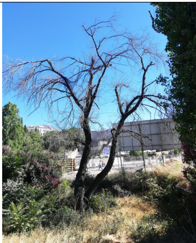
Exemplar 100673693064 – Ulmus sp.