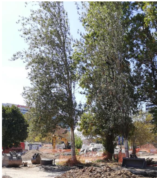
Exemplares 100673693132 e 100673693133 – Populus alba var. boleana